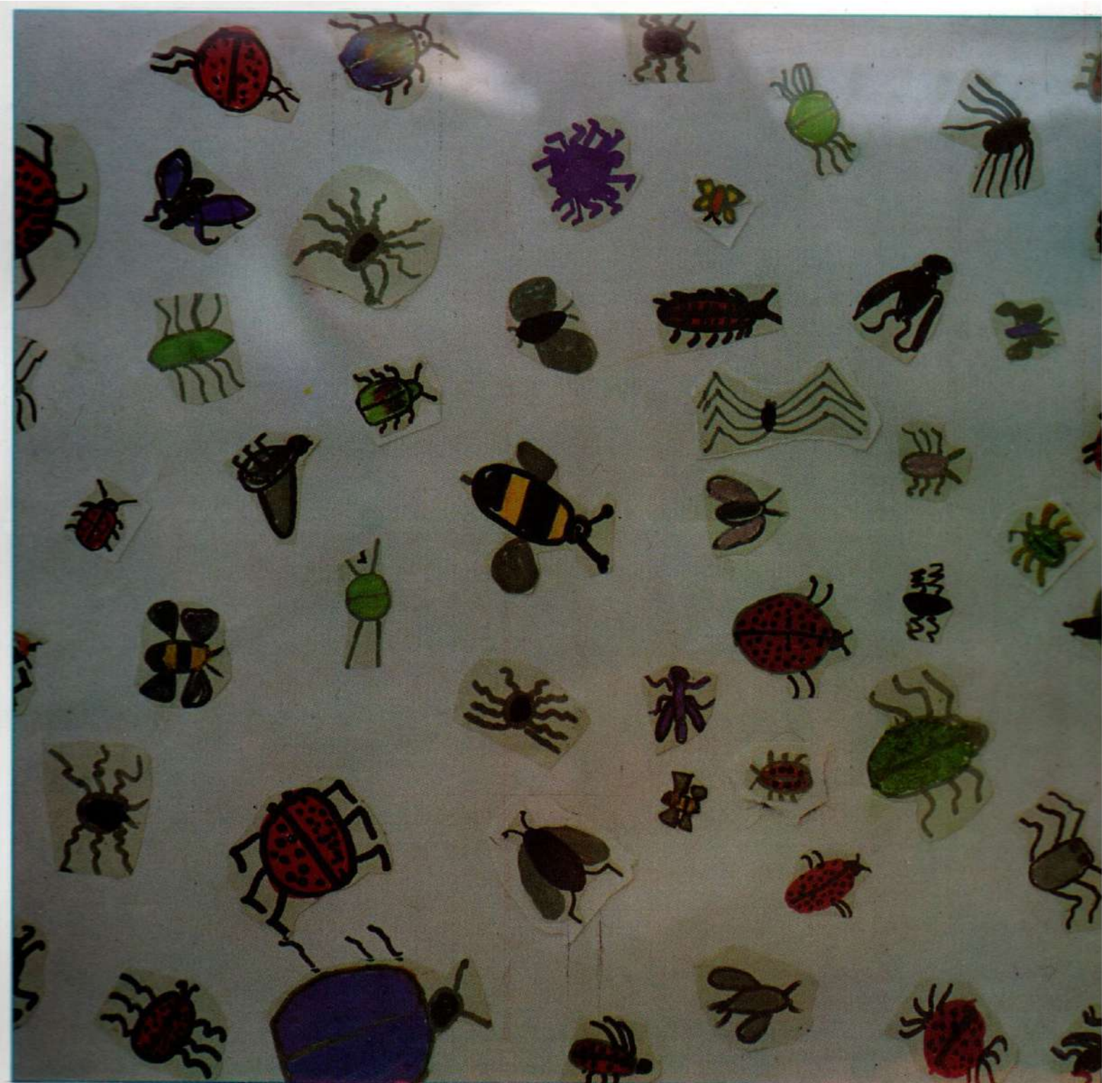
Ομαδική εργασία του τμήματος των μαθητών Δημοτικού Λεπιδόπτερα, υμενόπτερα, νευρόπτερα, δίπτερα, τριχόπτερα..... έχουν περιγραφεί πάνω από 80.000 διαφορετικά.