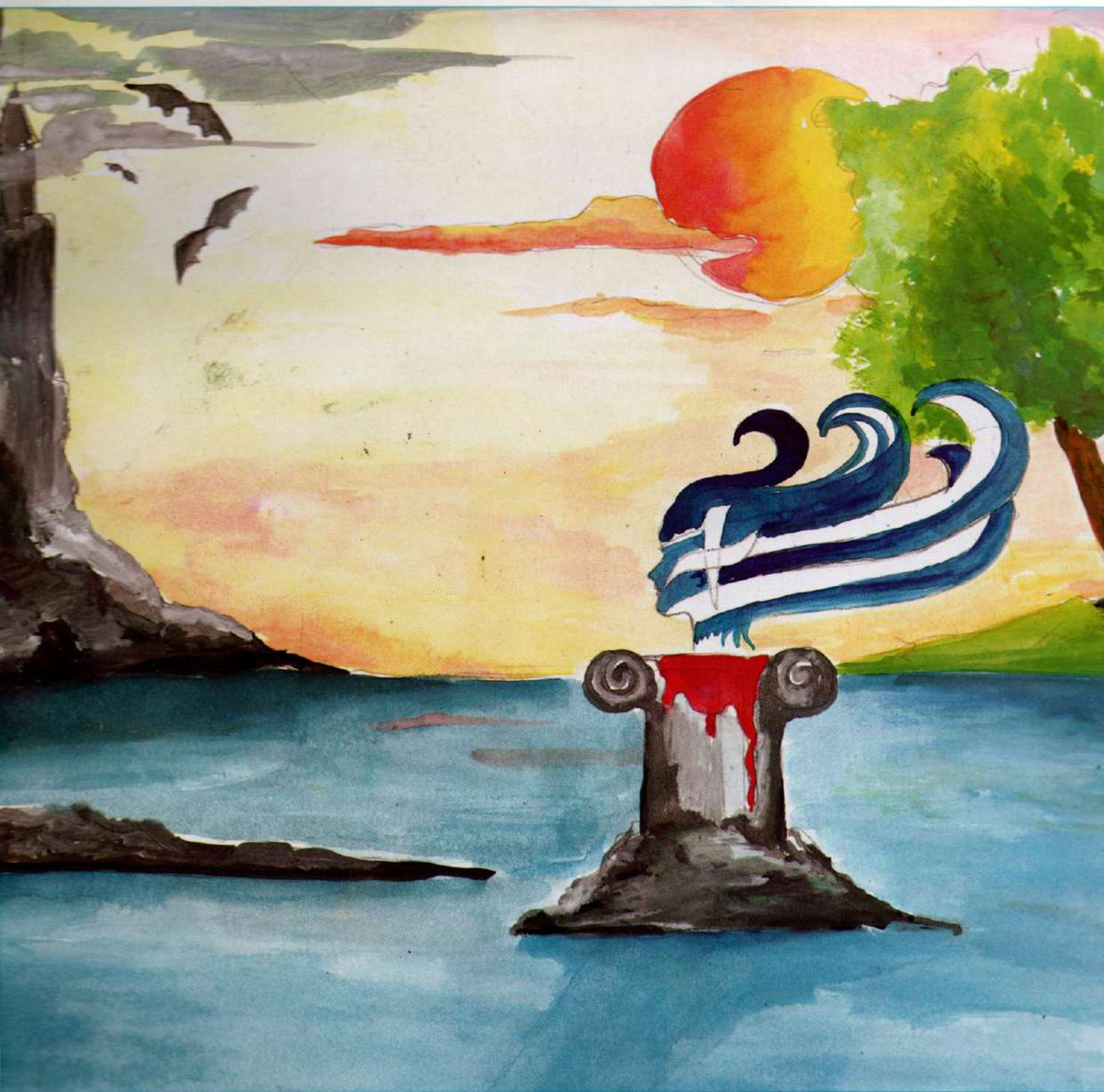
Νίκη Ι. Ίσκου, φοιτήτρια «Ομορφιά και δόξα χύνει όπου γη αιματωμένη» Γ. Γεωργόπουλος