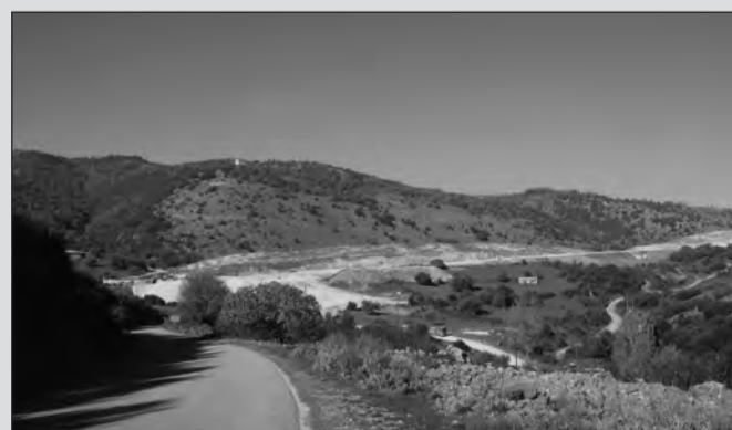
Τμήμα της Ιόνιας Οδού και το εργοτάξιο στη στροφή της Αμπελιάς, πίσω από το λόφο «Χιονάσα».