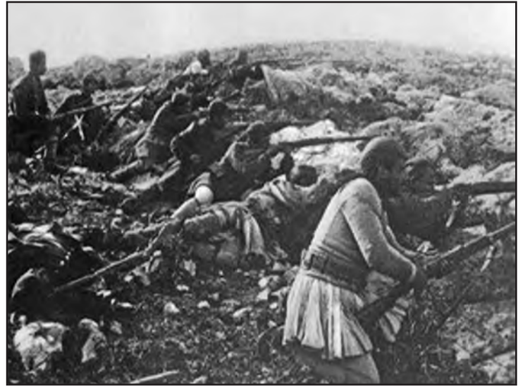
Η μάχη της Μανωλιάσσας

Το 9ον συν. πεζ. (μείον τάγματος) θα προήλαυε κατευθύνον το δεξιόν του προς το ύψωμα Αγ. Ηλίας υψ. 1076,22, το δ' αριστερόν του 1500 μ. ΒΑ. του χωρίου Μανωλιάσσα. Εν τάγμα τούτου θα παρέμενεν εις Άνω Θεριακίσι ως στήριγμα του πυρ/κου, οπόθεν θα προήλαυε προς συνάντησιν του υπολοίπου συν/τος του, ευθύς ως η δεξιώτερον ενεργούσα II Μεραρχία θα ήγετο διά της πεδιάδος προς τα υψώματα του χω-