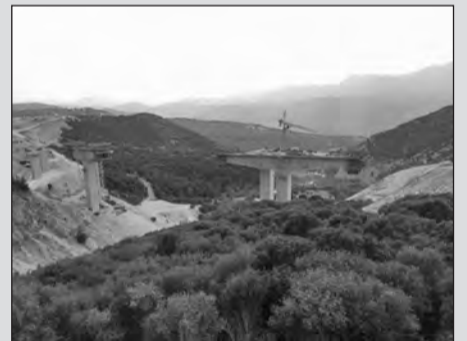
Η γέφυρα στο Τέροβο.

Στην κυριολεξία "φωτιά" έχουν πάρει τα έργα στην Ιόνια Οδό, όπου δίνεται μεγάλη μάχη με το χρόνο για να είναι έτοιμος ο αυτοκινητόδρομος, όσο το δυνατόν γρηγορότερα.