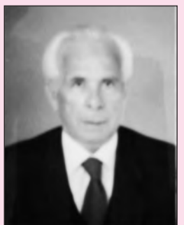
Γράφει ο Στέφανος Κων. Γιωτάκης