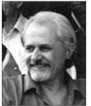
Γράφει ο Νικόλαος Σ. Χρόνης Απόμαχος Πλοίαρχος

Συζητούσα μαζί τους μ' αυτά τα παιδιά και μιλούσαν ήρεμα, ήσυχα, με καλοσύνη. Προσπαθούσαν να με πείσουν ότι ακολουθούσαν ορισμένες χριστιανικές εντολές. Θαύμαζαν τον Βούδα και την φιλοσοφία του. Γεννημένος πρίγκηπας σε βασιλική οικογένεια, απαρνήθηκε όλα τα πλούτη και αποτραβή-