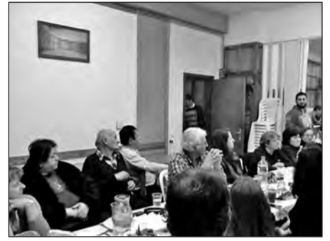
Στιγμιότυπα από την εκδήλωση στο Πνευματικό Κέντρο