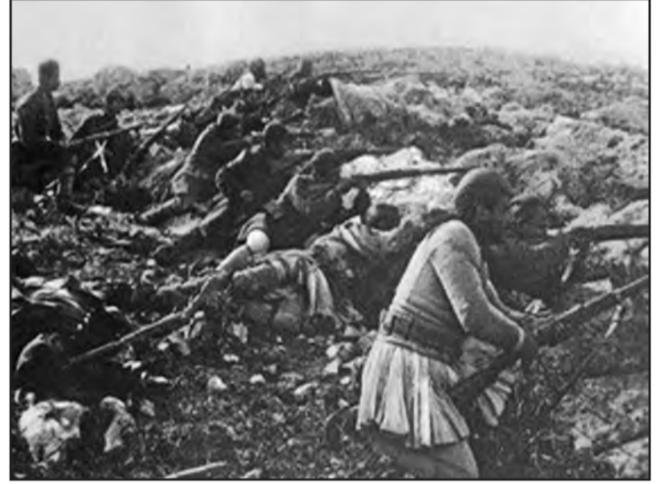
Η μάχη της Μανωλιάσσης

3) Την 25ην Δ/βρίου, εν συνεχεία των συντελουμένων προπαρασκευών, η IV Μεραρχία υποβαήουσα την έκθε-