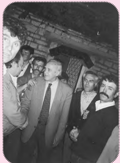
Η επίσκεψη του προέδρου της Δημοκρατίας Κ. Κάρροθου Παπούλια στη Μανωλιάσσα το 1981.

Φωτογραφίες που μας ταξιδεύουν πίσω στο χρόνο