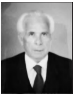
Γράφει ο Στέφανος Κων. Γιωτάκης

Από τότε, όταν συμβαίνει κάτι παρόμοιο, λέμε «τον έπιασε στα πράσα».