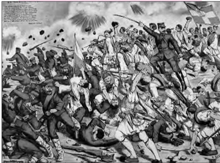
Η μάχη του ταγματάρχη Βελισσαρίου, επί κεφαλής των Ευζώνων του, στην Κρέσα.

Μοιρολογούνε τα βουνά και οι κάμποι αναστενάζουν! Και οι τσολιάδες τον θρηγούν Λεβεντοταγματάρχη! Μες τον πολέμου τη φωτιά ορθός επολεμούσε και φόβο δε λογάριάζε το χάρο δε ψηφούσε Κλάψτε αετοί τον Σταυραετό! Κλάψτε το Βελισσάρη! Τι το κακό που γίνηκε στη Τζουμαγιά στη ράχη ο Βελισσάρης πέθανε και ο βασιλιάς ταράχθη. Ο Βλάχος του ο σαλπικτής βαριά τραυματισμένος όταν μαθαίνει το χαμό πριν ξεψυχήσει λέει: Θα ήθελα στον τάφο σου δυο λόγια να σαλπίσω να γονατίσω ευλαβικά, στερονά να ξεψυχήσω! Ν' ακούσουνε τα Γιάννενα κι ο Λαχανάς να μάθει κι η Κύμη που τον γέννησε: Ο Βελισσάρης πέθανε, ο Βελισσάρης χάθη!