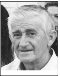
Γράφει ο Χρήστος Νίκου

Όταν ο βασιλιάς Κωνσταντίνος πληροφορήθηκε το θάνατό του λέγεται πως είπε: «Ήταν επόμενο. Τέτοιοι ήρωες δε ζουν πολύ». Στο συλλυπητήριο τηλεγράφημα που συνέταξε και απέστειλε προς τη σύζυγό του Χαρίκλεια, έγραφε τα εξής: «Χαιρετίζω τον Ήρωα των Ηρώων».