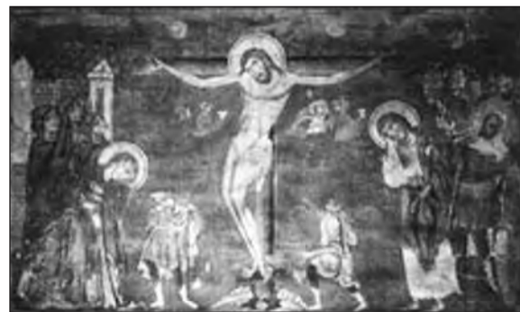
Η Σταύρωση της μονής Μαυριώτισσας (καθολικό). Τοιχογραφία με τη Σταύρωση του Χριστού, περ. 1260 μ.Χ.

Ο μονόχωρος ναός με νάρθηκα της Παναγίας της Μαυριώτισσας, καθολικό της ομώνυμης μονής, είναι ίσως κτίσμα του 11ου αι. Δίπλα του ιδρύθηκε στον 16ο αι. παρεκκλήσι αφιερωμένο στον Ιωάννη το Θεολόγο με τοιχογραφίες του 1552,