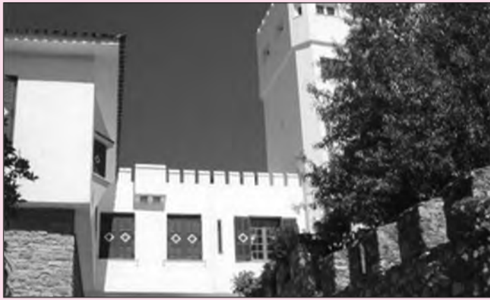
Τα Μποτσαραιίκα στη Ναύπακτο. Ανήκουν στο ίδρυμα Δημητρίου και Αίγλης Μπότσαρη και στεγάζουν τη μόνιμη έκθεση «Η ναυμαχία της Ναυπάκτου».

Τιμή και δόξα στους Σουλιώτες και Σουλιώτισσες, θα τους θαυμάζουμε και θα τους θυμόμαστε για πάντα.