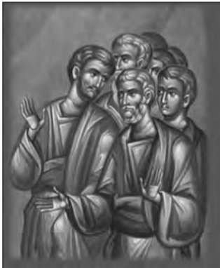
Παλαιότερες αγιογραφίες του Κ. Γιωτάκη

Η αγιογραφική τέχνη, πέραν των άλλων, απαιτεί θεία έμπνευση. Στην εποχή