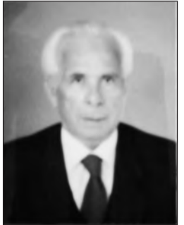
Γράφει ο Στέφανος Κων. Γιωτάκης

Πιστεύω να με ακούσατε και ευελπιστώ σε σχετική απάντησή σας.