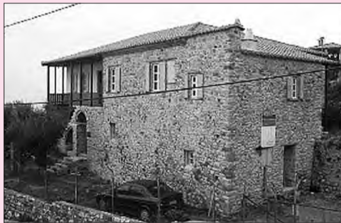
Άποψη του Τζαβεθαίικου στη Ναύπακτο. Έχει αναστηλωθεί πρόσφατα από την αρχαιολογική υπηρεσία και το Υπουργείο Πολιτισμού.

Έτσι, οι ταλαιπωρημένοι Ηπειρώτες, επανήλθαν στις 24 Ιουλίου 1829, αυτή τη φορά με αίτησή τους