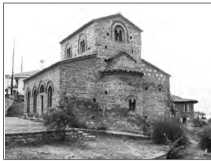
Άγιοι Ανάργυροι (11ος αι. μ.Χ.)

Η βιαιότητα και οι παραμορφώσεις στο σχέδιο φθάνουν