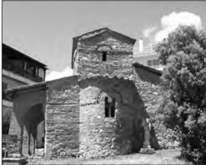
Ο Ταξiάρχης Μητροπόλεως (10ος αι. μ.Χ.) της δεξιαμενής το 1922.