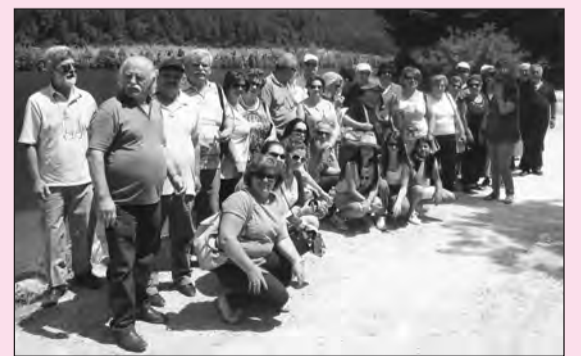
Στη σελίδα 4

Άλλοι σκάφτουν κι κλαδεύουν, κι άλλοι πίνουν κι μιθάν.