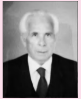
Γράφει ο Στέφανος Κων. Γιωτάκης