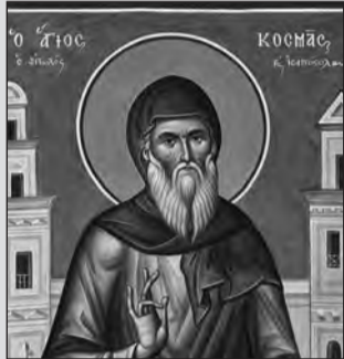
Γράφει ο Στέφανος Κων. Γιωτάκης

Φέτος συμπληρώνονται 300 χρόνια από τη γέννηση του Πατροκοσμά και με την ευκαιρία του γεγονότος αυτού δημοσιεύονται στα «Ύαχνάρια» τα παρακάτω σε ένδειξη τιμής, σεβασμού, αγάπης αλλά και αναγνώρισης των όσων έπραξε Εκείνος για την απελευθέρωση του Έθνους.