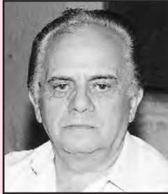
Γράφει ο Κώστας Ε. Γιαννούλας Σχοή. Σύμβουλος Δ.Ε. Πτυχιούχος Φ.Π.Ψ.

Είναι δύσκολο να αλλάξει νοοτροπία ένας λαός με μακρά παράδοση, όπως ο Ελληνικός, αλλά σίγουρα είναι κατορθωτό. Το βλέπουμε σήμερα να γίνεται σε όλες τις νέες ισχυρές χώρες. Οι κοινωνίες άλλαξαν νοοτροπία, έχουν γίνει άλλοι λαοί έπειτα από αιώνες. Αυτό πρέπει να επιδιώξουμε, γιατί αυτό χρειάζομαστε.