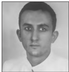
μό του κελευστή.

• Στις 8 Αυγούστου 2013, πλήρης ημερών έφυγε από τη ζωή η Πανάγιο Γεωργίου Γιωτάκη . Ήταν γεννημένη το 1910 και παντρεμένη με τον Γιώργο Γιωτάκη. Απέκτησαν τέσ-