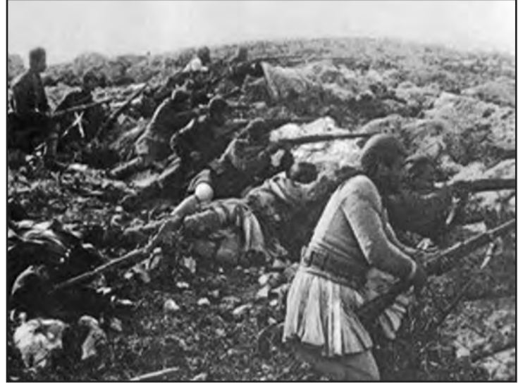
Η μάχη της Μανωλιάσσας

Εφοδιοπομπή } VI μοίρα πυρομαχικών } Πρέβεζαν