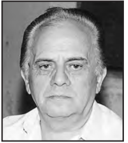
Γράφει ο Κώστας Ε. Γιαννούλας Σχολ. Σύμβουλος ε.α. Πτυχιούχος Φ.Π.Ψ.

Τέλος, όποια μορφή και αν έχουν οι θρησκείες, το θρησκευτικό συναίσθημα ισορροπεί τον άνθρωπο δίνοντάς του παρηγοριά και ελπίδα, αν και φυσικά υπάρχει μόνο μία θρησκεία, γιατί υπάρχει μόνο μία ΑΛΗΘΕΙΑ και επομένως καμία αίρεση, οποιοδήποτε και αν είναι το όνομά της, δεν μπορεί να διεκδικεί την αποκλειστική κατοχή αυτής της Μίας και ΜΟΝΗΣ ΑΛΗΘΕΙΑΣ.