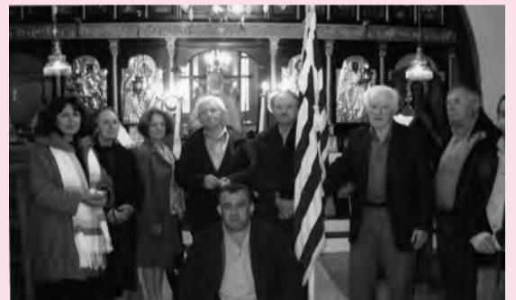
Το στιγμιότυπο από τη γιορτή της 28ης Οκτωβρίου στη Μανωλιάσσα, αδιάφευκτη μαρτυρία της συρρίνωσης των χωριών. Το μήνυμά της γιορτής είναι ηχηρό και φθάνει στην εποχή μας δυνατό, επίκαιρο και αναγκαίο. Είναι το μεγάλο Όχι.