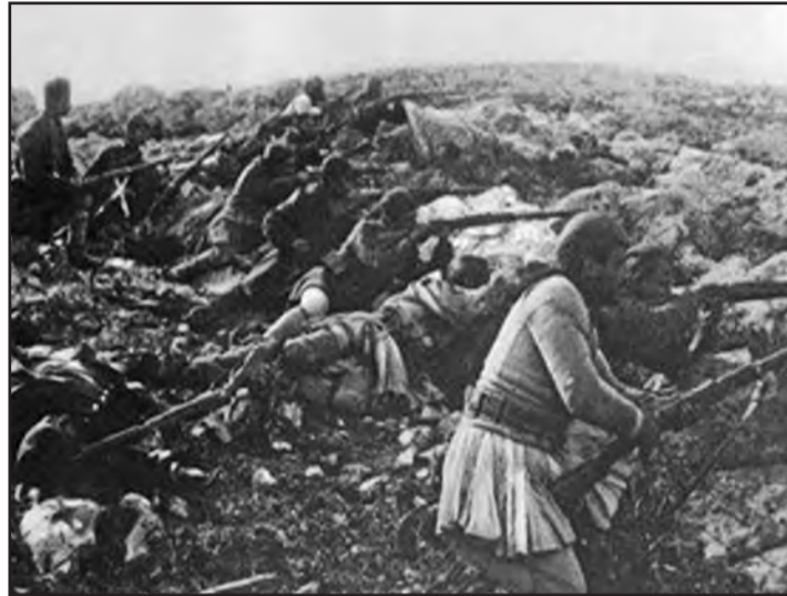
Η μάχη της Μανωλιάσσας

Το Αρχηγείον διέταξε την ισχυράν κατάληψιν των δεσποζόντων υψωμάτων Κέντρωμα υπό τμημάτων της Μεραρχίας, την σοβαράν δε παρενόχησιν του εχθρικού πεζικού υπό του φιλιού πεδ. πυρ/κού. Περαιτωθείσης της οδεύσεως, η σκευή των