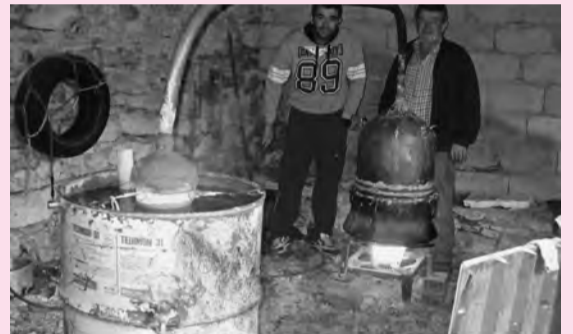
Τα στέφλα βράζουν και το τσίπουρο στάζει σταγόνα-σταγόνα.