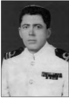
Συνέχεια από το προηγούμενο φύλλο