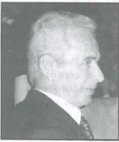
Γράφει ο Στέφανος Κ. Γιωτάκης

Η απότιση φόρου τιμής και ευγνωμοσύνης σ' εκείνους που θυσίασαν τη ζωή τους για την απελευθέρωση της πατρίδας είναι χρέος και ιερό καθήκον για τις γενιές που ακολουθούν.