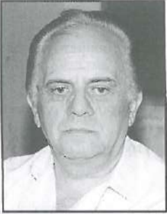
Γράφει ο Κ. Παννούθας Σχολικός Σύμβουλος ε.α. Πτυχιούχος Φ.Π.Ψ.